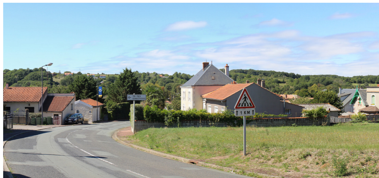
Photographie de l'état initial à 50°